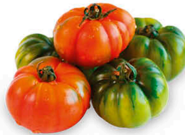
POMODORO CUORE DI BUE