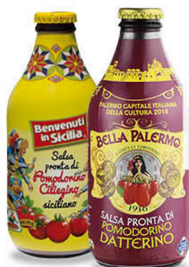
SALSA PRONTA DI POMODORO - CILIEGINO - DATTERINO 330 g - € 2,70 al kg