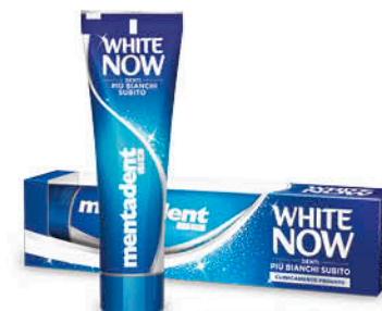
DENTIFRICIO MENTADENT WHITE NOW 75 ml - € 33,20 al L