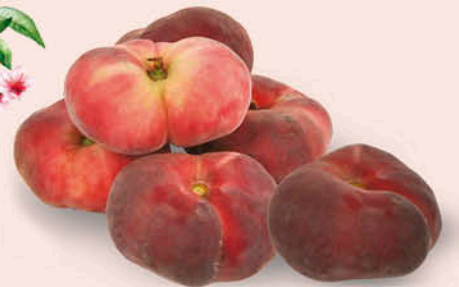
PESCHE TABACCHIERE 500 g - € 3,18 al kg