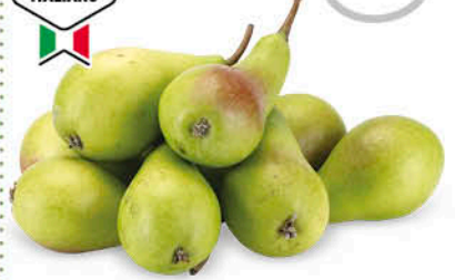
PERE COSCIA ORIGINE ITALIA 1 a CAT CAL. 50+