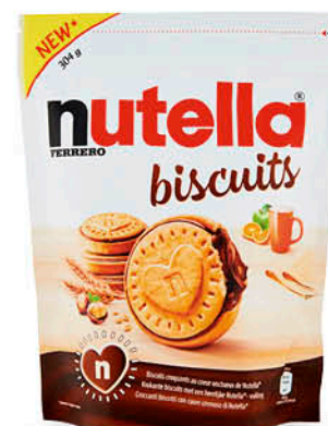
NUTELLA BISCUITS 304 g - € 9,18 al kg