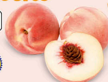
PESCHE BIANCHE BIVONA IGP ORIGINE ITALIA 1 a CAT - CAL. A