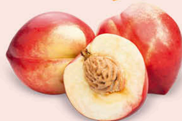
PESCHE NETTARINE BIANCHE CAL. AA