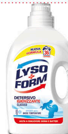
DETERSIVO LIQUIDO IGIENIZZANTE LYSOFORM 1,62 L - € 2,46 al L