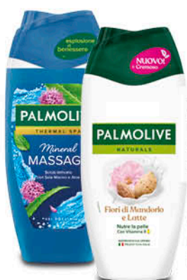
DOCCIA PALMOLIVE ASSORTITO 220 ml - € 4,50 al L