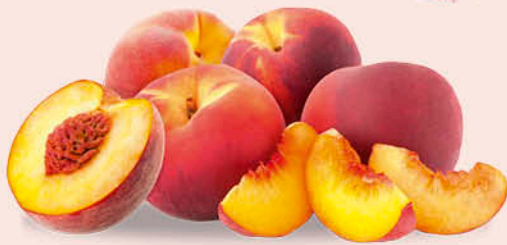
PESCHE GIALLE CAL. AA