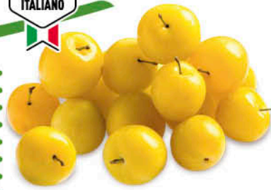
SUSINE GIALLE ORIGINE ITALIA 1 a CAT CAL. 45/50