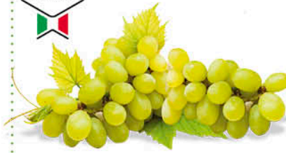
UVA BIANCA VITTORIA ORIGINE ITALIA 1 a CAT CAL. 150