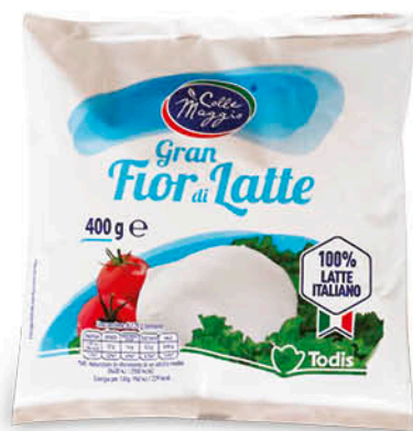
GRAN FIORDILATTE 400 g - € 7,45 al kg NEL REPARTO FRESCHI