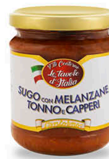
SUGO TONNO MELANZANE E CAPPERI 200 g - € 8,95 al kg