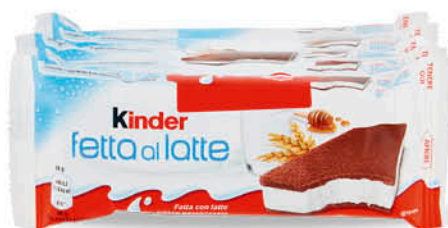
KINDER FETTA A LATTE 140 g - € 14,21 al kg NEL REPARTO FRESCHI