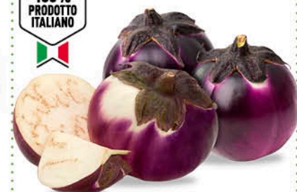
MELANZANE TONDE VIOLA ORIGINE ITALIA 1 a CAT CAL. 140/170