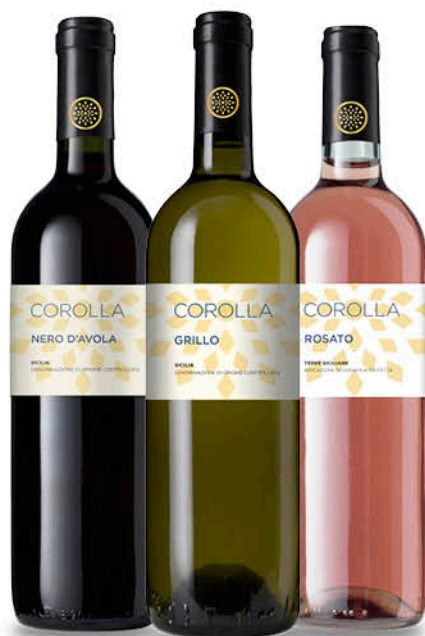
VINO COROLLA - NERO D'AVOLA DOC - GRILLO DOC - ROSATO IGP 75 cl - € 3,99 al L