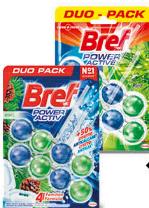
BREF POWER ACTIVE WC DUO PACK