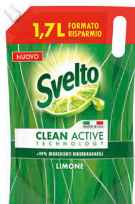
RICARICA DETERSIVO PIATTI SVELTO AL LIMONE 1,7 L - € 1,68 al L