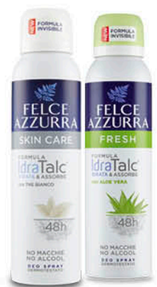
DEO SPRAY FELCE AZZURRA - FRESH - SKINCARE 150 ml - € 13,27 al L