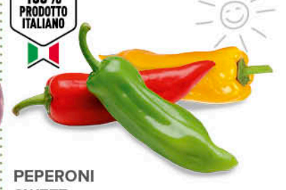
PEPERONI SWEET PALERMO ORIGINE ITALIA 1 a CAT 500 g € 3,98 al kg