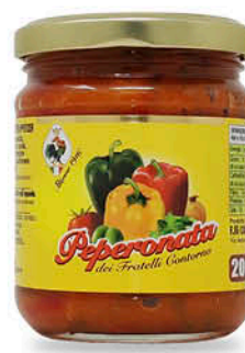
PEPERONATA FRATELLI CONTORNO 200 g - € 7,45 al kg