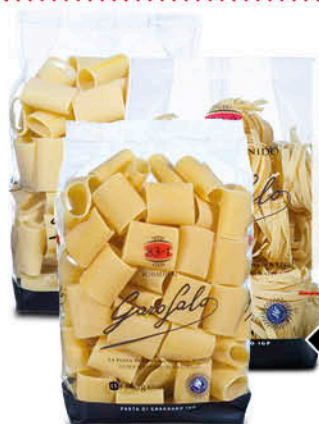
PASTA GAROFALO - GIGANTONI - SCHIAFFONI - TAGLIATELLE 500 g € 2,58 al kg