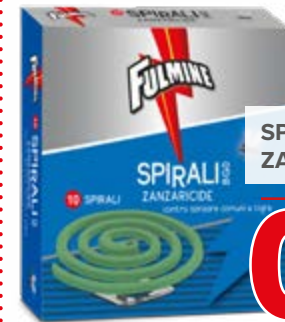
SPIRALI PER ZANZARE 10 PEZZI