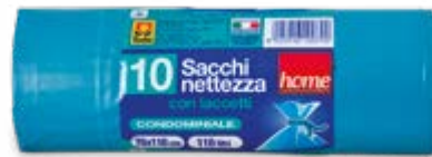
ROTOLO PATTUMIERA 70X110 CM 10 PEZZI