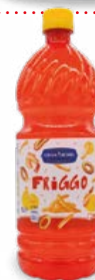
OLIO PER FRIGGERE 1 L