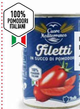
FILETTI IN SUCCO DI POMODORO 400/240 g - € 6,04 al kg