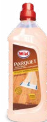
DETERSIVO PAVIMENTI PARQUET 1,25 L - € 1,20 al L