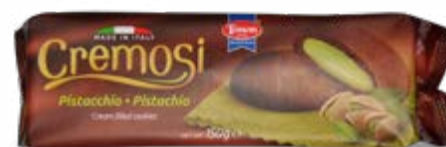
BISCOTTI CREMOSI AL PISTACCHIO 150 g - € 9,67 al kg