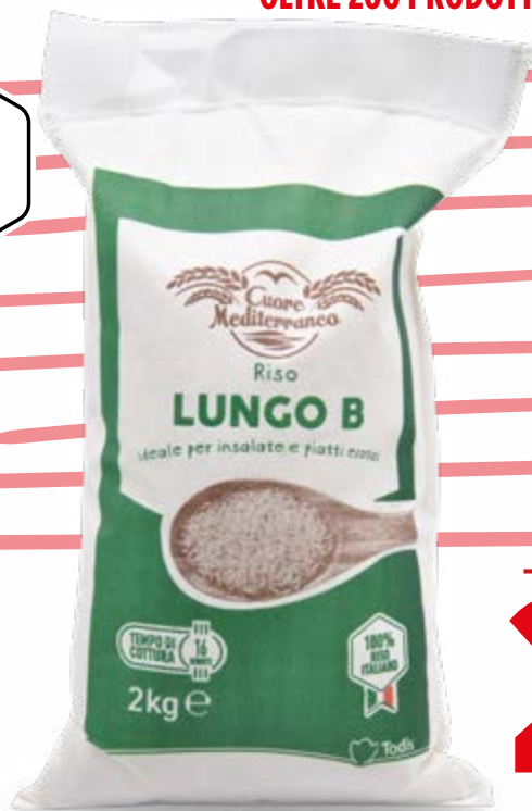
RISO LUNGO B 2 kg - € 1,48 al kg