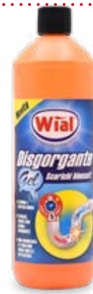
GEL DISGORGANTE 1 L