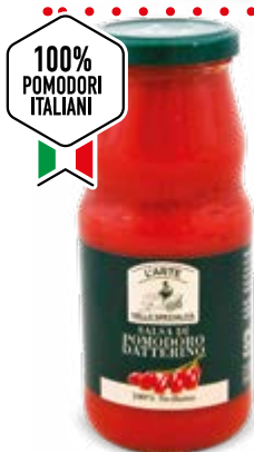
SALSA DI POMODORO DATTERINO SICILIANO 360 g - € 3,03 al kg