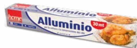
ROTOLO ALLUMINIO 30 METRI