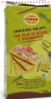
CRACKERS CON OLIO DI OLIVA E ROSMARINO 250 g - € 5,00 al kg