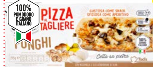
PIZZA FUNGHI BOSCO AL TAGLIERE 215 g - € 13,02 al kg