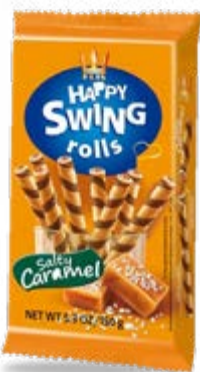
SWING ROLLS - CARAMELLO SALATO - COCCO 150 g - € 6,33 al kg