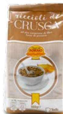
RICCIOLI DI CRUSCA 180 g - € 8,06 al kg