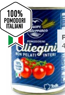
POMODORINI CILIEGINI 400/240 g - € 3,33 al kg