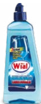
BRILLANTANTE 500 ml - € 3,18 al L