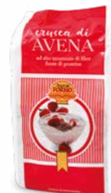
CRUSCA D'AVENA 250 g - € 6,60 al kg