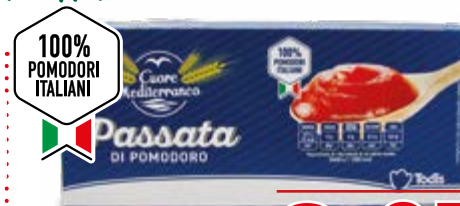
PASSATA DI POMODORO 3x200 g - € 1,58 al kg