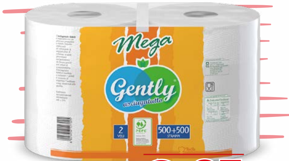
MEGA ASCIUGATUTTO 2 VELI 1000 STRAPPI

OLTRE 200 PRODOTTI RIBASSATI E BLOCCATI FINO AL 20 OTTOBRE 2024 METTICI ALLA PROVA!