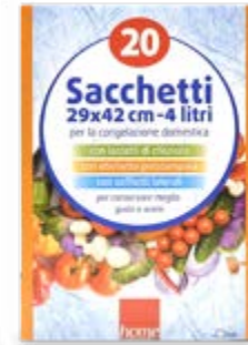
SACCHETTI GELO VARIE MISURE