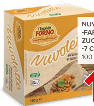
NUVOLETTE -FARRO E SEMI DI ZUCCA -7 CEREALI 100 g - € 14,50 al kg