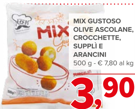
MIX GUSTOSO OLIVE ASCOLANE, CROCCHETTE, SUPPLI E ARANCINI 500 g - € 7,80 al kg