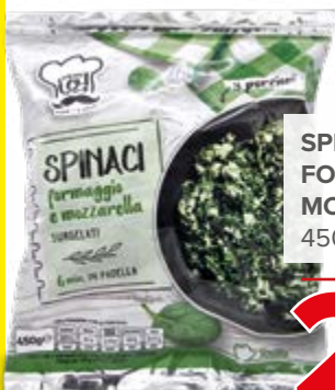
SPINACI FORMAGGIO E MOZZARELLA 450 g - € 5,53 al kg