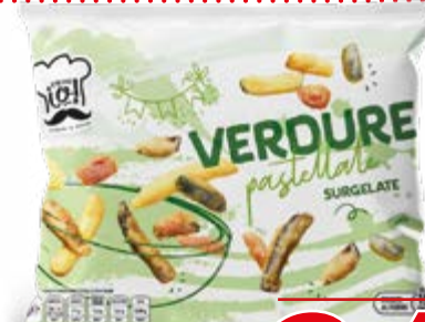
MIX 5 VERDURE PASTELATE 300 g - € 8,17 al kg