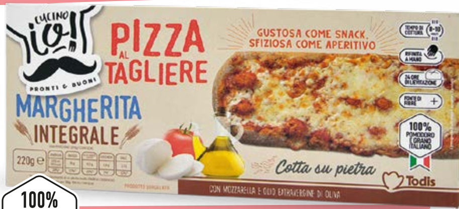
PIZZA MARGHERITA INTEGRALE 220 g - € 10,86 al kg

OLTRE 200 PRODOTTI RIBASSATI E BLOCCATI FINO AL 20 OTTOBRE 2024 METTICI ALLA PROVA!