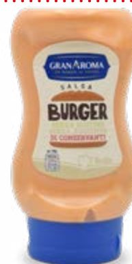
SALSA BURGER 250 ml - € 5,80 al L