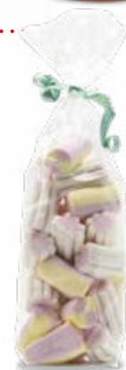
MARSHMALLOW COTONE DOLCE 150 g - € 6,33 al kg