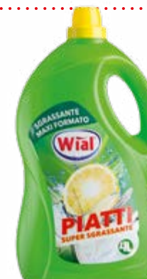
DETERSIVO PER PIATTI AL LIMONE 4 L - € 0,70 al L