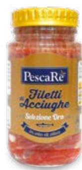
FILETTI DI ACCIUGHE IN OLIO DI OLIVA SELEZIONE ORO 140 g - € 33,57 al kg