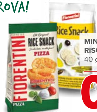
MINI GALLETTE DI RISO VARI TIPI 40 g - € 23,75 al kg