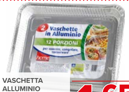
VASCHETTA ALLUMINIO RETTANGOLARE 12 PORZIONI 2 PEZZI