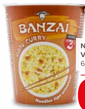
NOODLES VARI TIPI 67 g - € 12,69 al kg