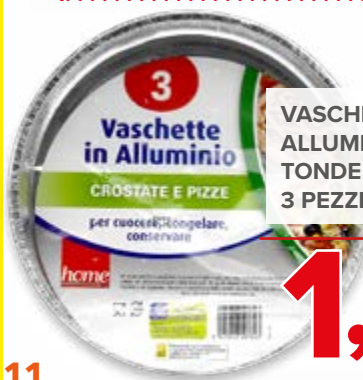
VASCHETTE ALLUMINIO TONDE BASSE 3 PEZZI