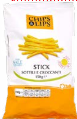
PATATINE STICK SOTTILI E CROCCANTI 150 g - € 7,00 al kg