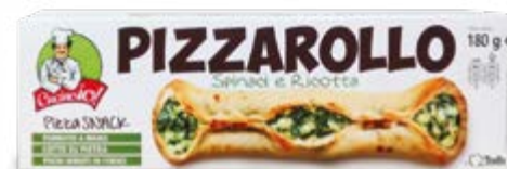
PIZZAROLLO SPINACI E RICOTTA 180 g - € 8,61 al kg