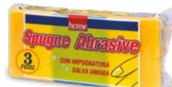
SPUGNE ABRASIVE SAGOMATE 3 PEZZI