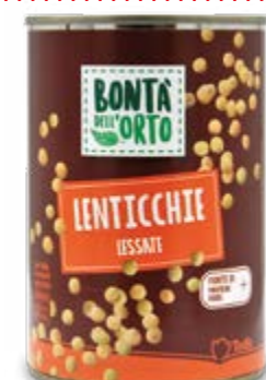
- LENTICCHIE - CECI 400/240 g € 2,29 al kg