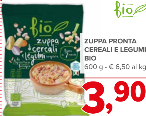
ZUPPA PRONTA CEREALI E LEGUMI BIO 600 g - € 6,50 al kg