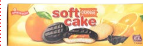
BISCOTTI CON ARANCIA RICOPERTI DI CIOCCOLATO 150 g - € 11,67 al kg