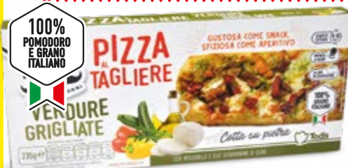
PIZZA AL TAGLIERE VERDURE GRIGLIATE 235 g - € 12,13 al kg