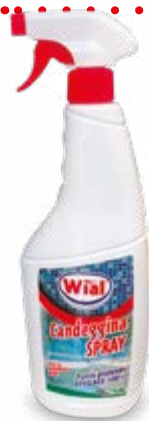
CANDEGGINA SPRAY 1 L