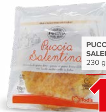
PUCCIA SALENTINA 230 g - € 5,87 al kg