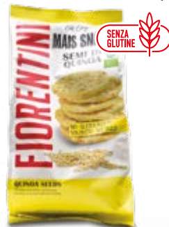
MINI GALLETTE QUINOA BIO SENZA GLUTINE 50 g - € 19,00 al kg