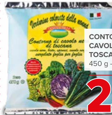
CONTORNO CAVOLO NERO TOSCANA 450 g - € 5,22 al kg