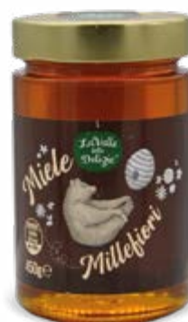
MIELE MILLEFIORI 450 g - € 6,56 al kg