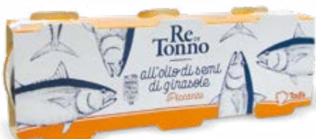
TONNO PICCANTE IN OLIO DI SEMI 3x80 g - € 10,92 al kg