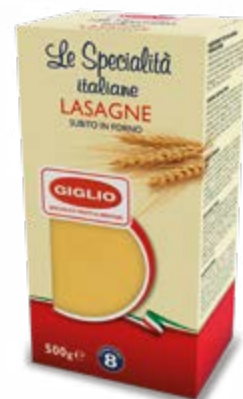
LASAGNE DI SEMOLA DI GRANO DURO 500 g - € 3,58 al kg