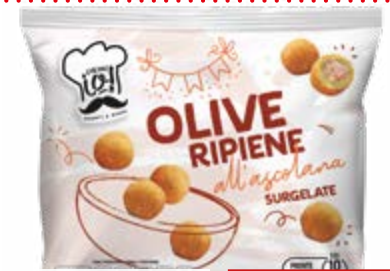
OLIVE ALL'ASCOLANA PREFRITE 500 g - € 7,60 al kg