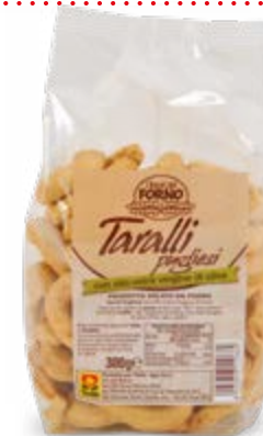
TARALLI PUGLIESI 300 g - € 4,30 al kg