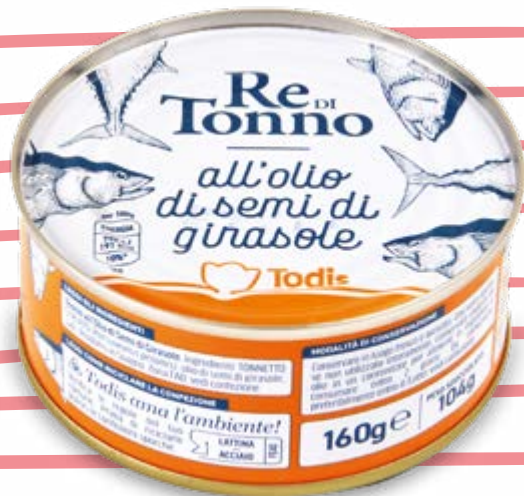
TONNO IN OLIO DI SEMI DI GIRASOLE 160 g - € 10,31 al kg

OLTRE 200 PRODOTTI RIBASSATI E BLOCCATI FINO AL 20 OTTOBRE 2024 METTICI ALLA PROVA!