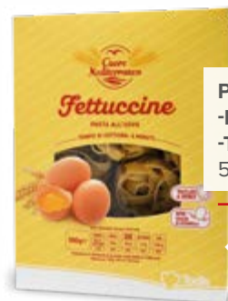
PASTA ALL'UOVO - FETTUCCINE - TAGLIATELLE 500 g - € 2,78 al kg