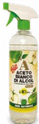
ACETO ALCOL BIO 8% MELA SPRAY 75 cl - € 3,27 al L