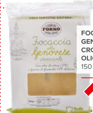
FOCACCIA GENOVESE CROCCANTE CON OLIO DI OLIVA 150 g - € 13,27 al kg