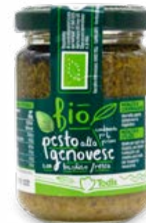
PESTO GENOVESE BIO 130 g - € 20,69 al kg