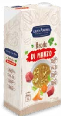
BRODO PRONTO DI MANZO 1 L