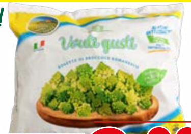
BROCCOLO ROMANESCO 600 g - € 3,33 al kg