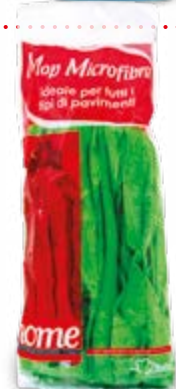
MOP MICROFIBRA PER PAVIMENTI