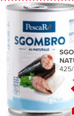
SGOMBRI AL NATURALE 425/275 g - € 8,33 al kg