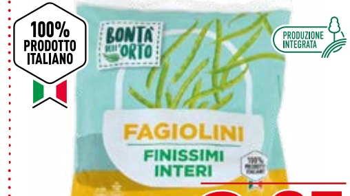
FAGIOLINI FINISSIMI INTERI 1 kg