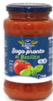
SUGO AL BASILICO 400 g - € 2,98 al kg