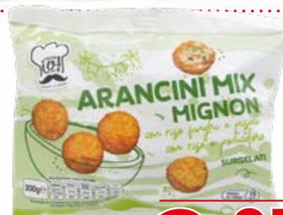
MIX ARANCINI MIGNON 300 g - € 6,83 al kg