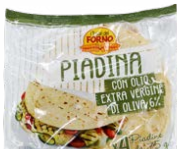
PIADINA CON OLIO EXTRA VERGINE DI OLIVA 300 g - € 4,50 al kg