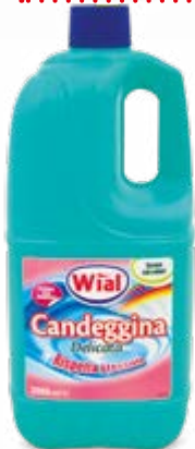
CANDEGGINA DELICATA 2 L - € 0,78 al L