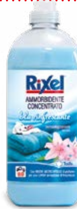
AMMORBIDENTE CONCENTRATO BLU 1,5 L - € 1,07 al L