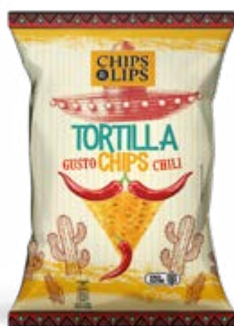
TORTILLAS CHIPS CHILI 200 g - € 5,75 al kg