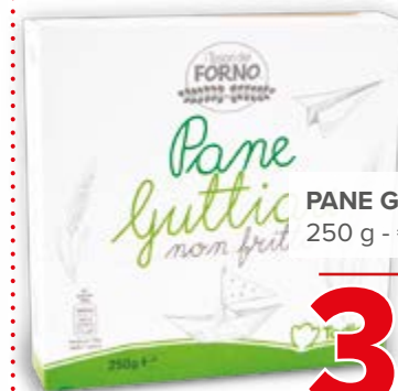
PANE GUTTAU 250 g - € 12,36 al kg