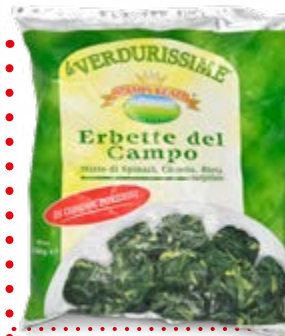
ERBETTE DI CAMPO A CUBETTI 450 g - € 4,33 al kg