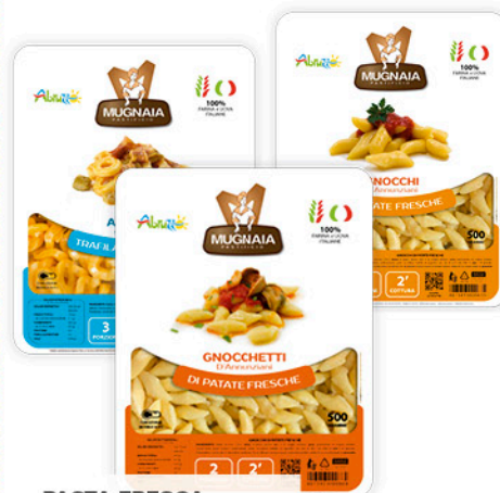
PASTA FRESCA MUGNAIA - GNOCCHI - GNOCCHETTI - ANELLI ALLA PECORARA 500 g - € 4,78 al kg