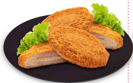
CORDON BLEU 540 g - € 4,61 al kg