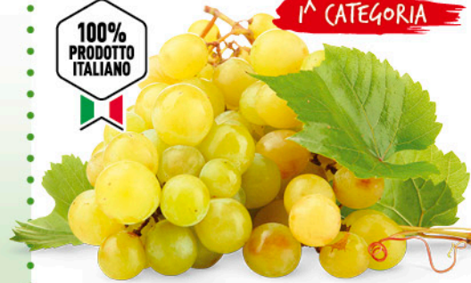
UVA DA TAVOLA BIANCA ITALIA ORIGINE ITALIA I a CAT 2 kg - 2,99 a conf.