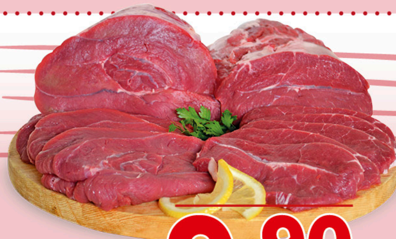
FETTINE ALLA PIZZAIOLA BOVINO ADULTO