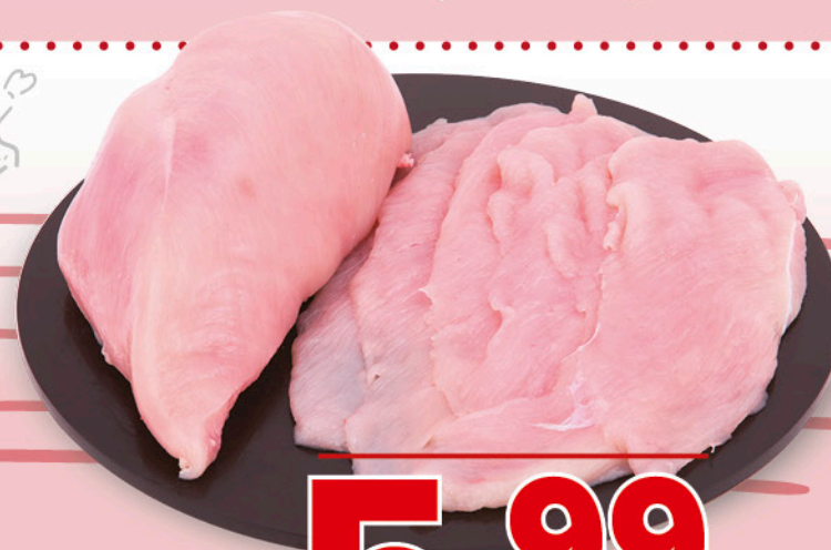
PETTO DI POLLO A FETTE CONFEZIONE FAMIGLIA