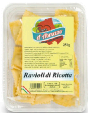
RAVIOLI "CUOR D'ABRUZZO" ALLA RICOTTA 250 g - € 7,96 al kg