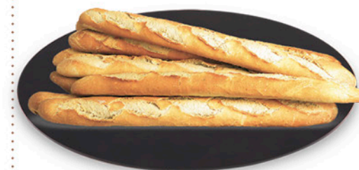
BAGUETTE CLASSICA € 1,88 al kg