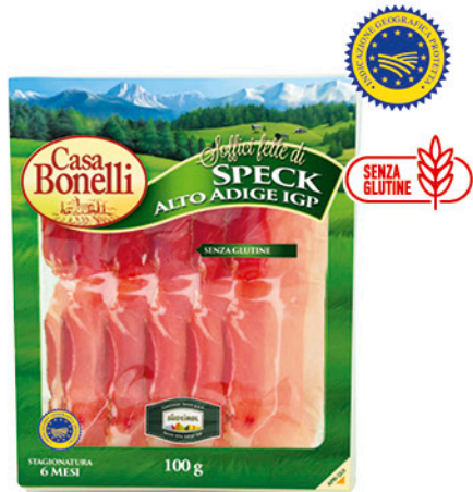
SPECK ALTO ADIGE IGP 100 g - € 15,90 al kg