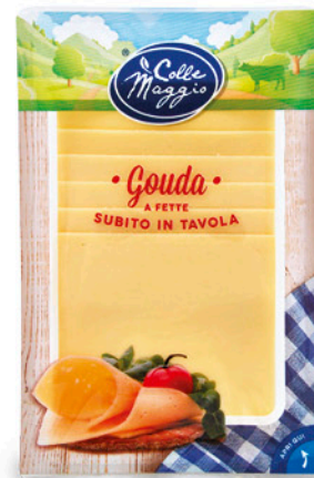
FORMAGGIO A FETTE GOUDA 150 g - € 8,60 al kg