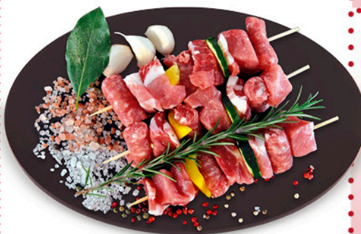
SPIEDINO DI SUINO