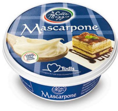
MASCARPONE 250 g € 5,12 al kg