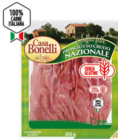
PROSCIUTTO CRUDO NAZIONALE 16 MESI 120 g - € 16,25 al kg