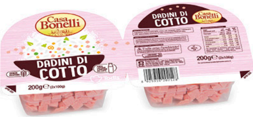
DADINI COTTO 200 g - € 7,45 al kg