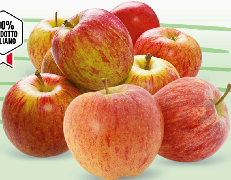
MELE GALA ORIGINE ITALIA II a CAT - CAL. 70+