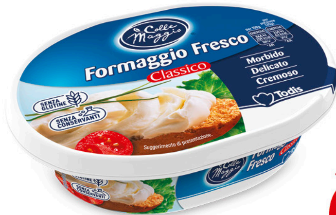
FORMAGGIO FRESCO CLASSICO 200 g - € 4,45 al kg