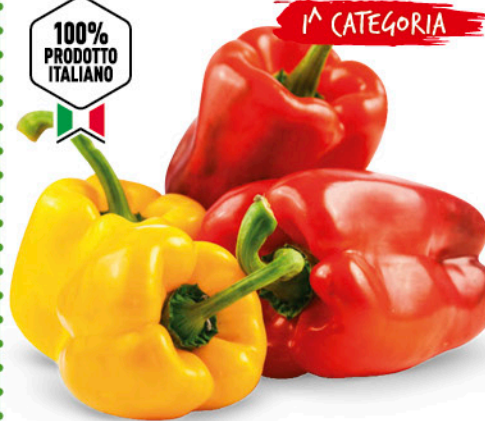
PEPERONI GIALLI E ROSSI ORIGINE ITALIA I a CAT