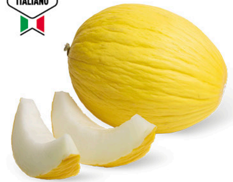
MELONE GIALLO ORIGINE ITALIA I a CAT