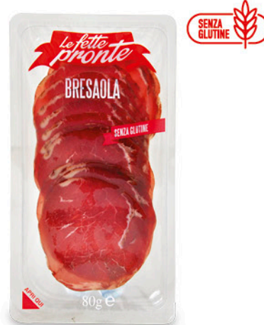
BRESAOLA 80 g - € 22,38 al kg