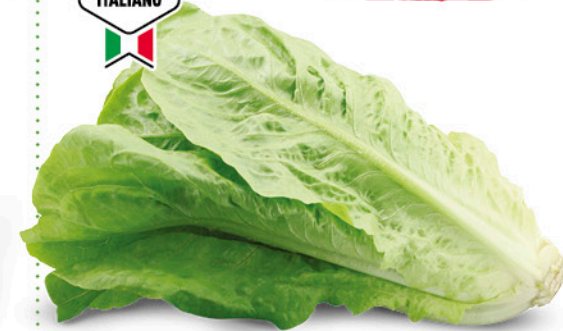
LATTUGA ROMANA ORIGINE ITALIA I a CAT