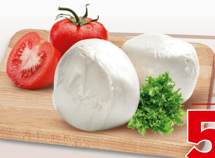
MOZZARELLA FIOR DI LATTE