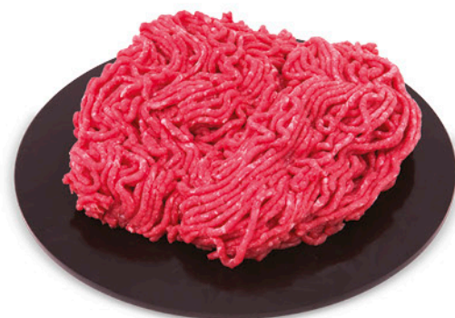
MACINATO BOVINO ADULTO