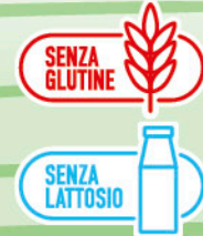
PROSCIUTTO COTTO SCELTO 150 g - € 8,33 al kg