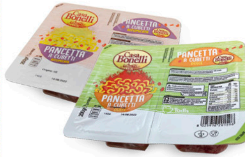
PANCETTA A CUBETTI - DOLCE - AFFUMICATA 2x100 g - € 8,75 al kg