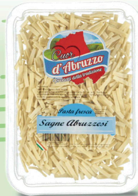
SAGNE BIANCHE CUOR D'ABRUZZO 500 g - € 3,98 al kg