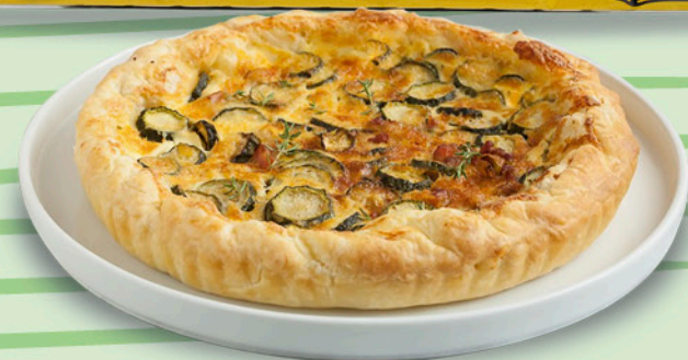
PASTA SFOGLIA ROTONDA 230 g - € 3,43 al kg