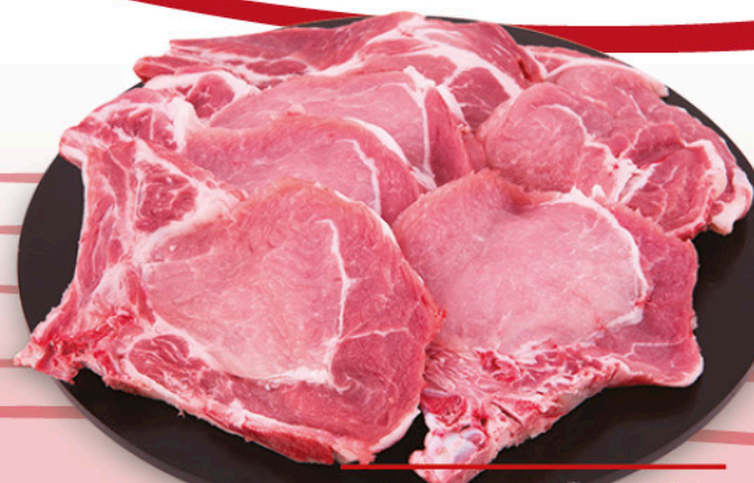
BRACIOLA DI LOMBO DI SUINO CON OSSO