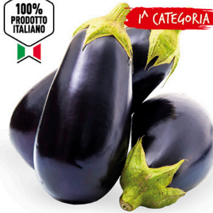
MELANZANE TONDE SCURE ORIGINE ITALIA I a CAT