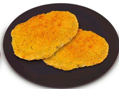
COTOLETTA DI POLLO 500 g - € 4,60 al kg