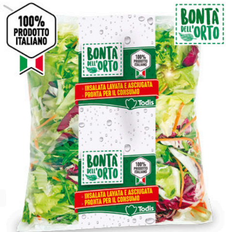
INSALATA VARI FORMATI