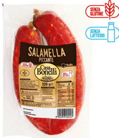
SALAMELLA CURVA DOLCE E PICCANTE 320 g - € 7,16 al kg