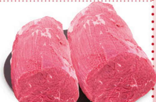
GIRELLO DI BOVINO ADULTO A TRANCIO SOLO PER PDV CON LAVORAZIONE REPARTO CARNI