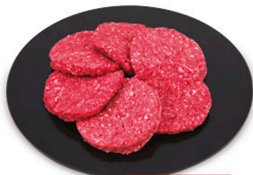
HAMBURGER DI BOVINO ADULTO