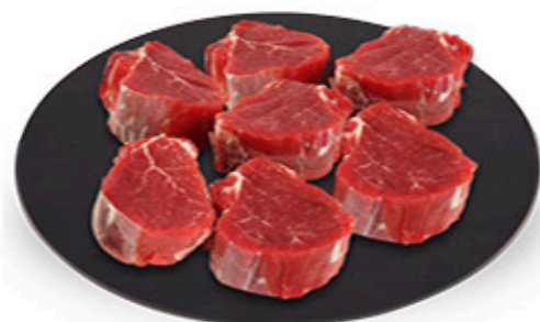
CARNE PER RAGÙ DI BOVINO ADULTO SOLO PER PDV CON LAVORAZIONE REPARTO CARNI