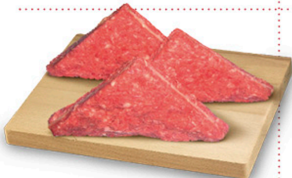
TRAMEZZINI DI SUINO 210 g - € 11,42 al kg