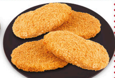
COTOLETTA DI POLLO FORMATO CONVENIENZA 500 g - € 4,60 al kg