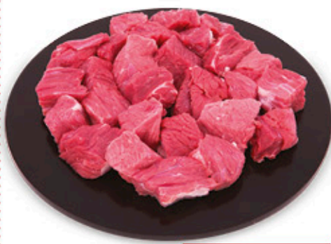
BOCCONCINI DI BOVINO ADULTO