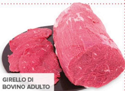
GIRELLO DI BOVINO ADULTO A FETTE SOLO PER PDV CON LAVORAZIONE REPARTO CARNI