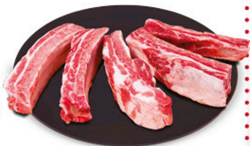
COSTINE DI SUINO