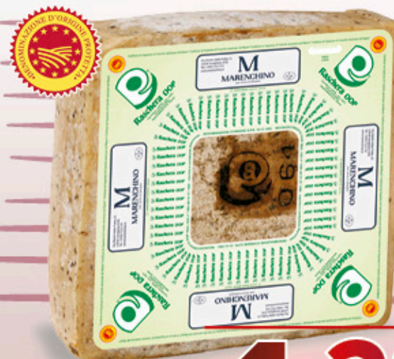
FORMAGGIO RASCHERA DOP NEL REPARTO GASTRONOMIA