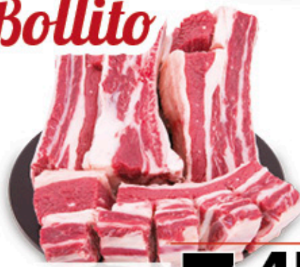
BOLLITO CON OSSO BOVINO ADULTO