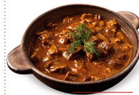
GULASCH DI BOVINO