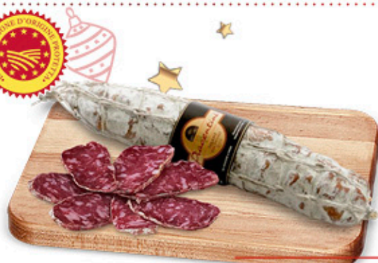
SALAME PIACENTINO DOP NEL REPARTO GASTRONOMIA