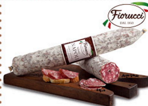
SALAME NAPOLI FIORUCCI