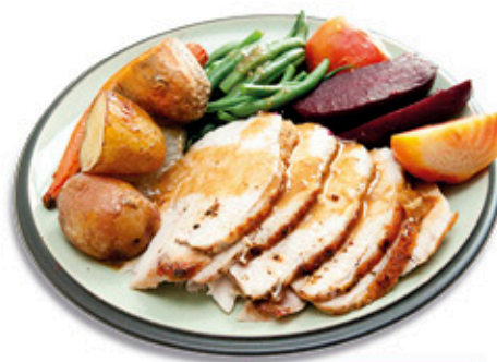
ARROSTO DI TACCHINO