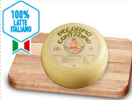
PECORINO DEL BUON CONTADINO