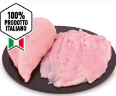
100% PRODOTTO ITALIANO PETTO DI POLLO A FETTE