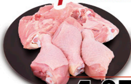
- FUSI DI POLLO - SOVRACOSCE DI POLLO