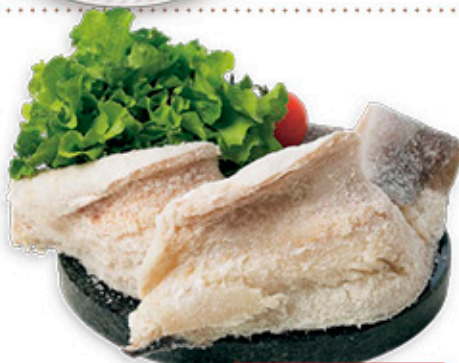
FILETTONI DI BACCALÀ