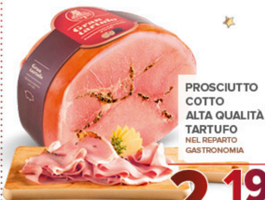
PROSCIUTTO COTTO ALTA QUALITÀ TARTUFO NEL REPARTO GASTRONOMIA