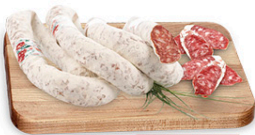
SALAME TORCIGLIONE NEL REPARTO GASTRONOMIA

ASPETTANDO IL NATALE dal 5 al 15 Dicembre