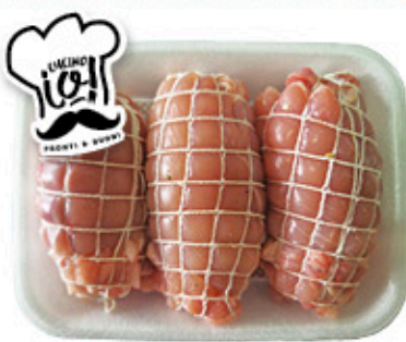
ROLLINI DI POLLO