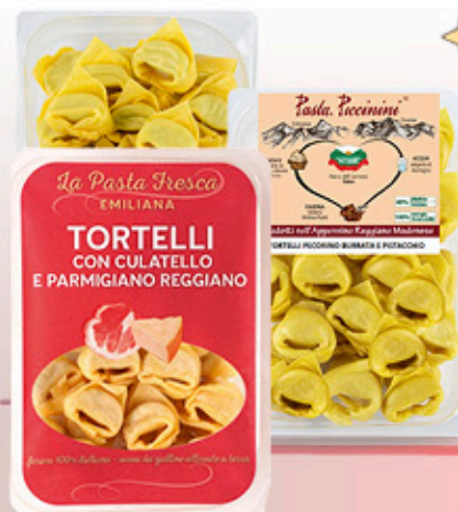
TORTELLI - RICOTTA E SPINACI - PECORINO, BURRATA E PISTACCHI - CULATELLO E PARMIGIANO 250 g - € 10,36 al kg NEL REPARTO GASTRONOMIA