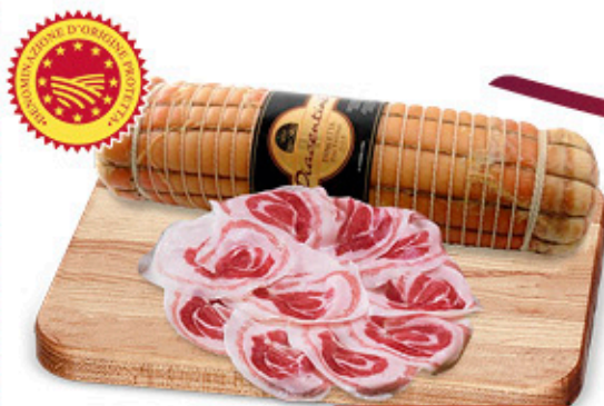
PANCETTA PIACENTINA DOP NEL REPARTO GASTRONOMIA