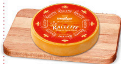
ENTREMONT RACLETTE NEL REPARTO GASTRONOMIA