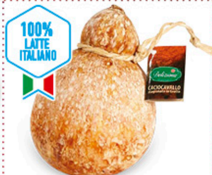
CACIOCAVALLO STAGIONATO IN GROTTA NEL REPARTO GASTRONOMIA