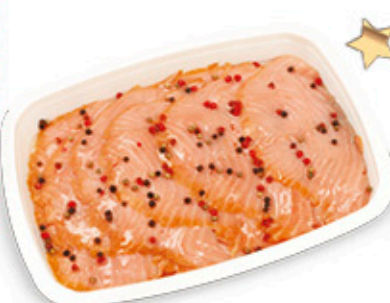
CARPACCIO DI SALMONE MARINATO NEL REPARTO GASTRONOMIA