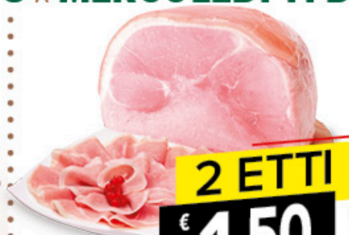
PROSCIUTTO COTTO GINEPRO