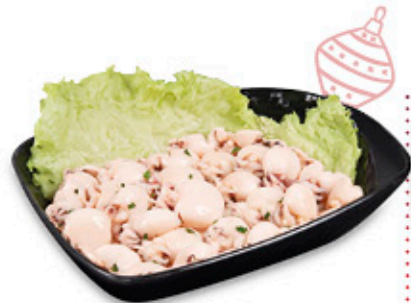
SEPIOLINE MARINATE NEL REPARTO GASTRONOMIA