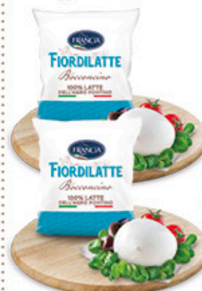
- FIORDILATTE FRANCIA 350 g - BOCCONCINO FRANCIA 140 g