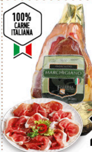
PROSCIUTTO MARCHIGIANO FALERIA STAGIONATO 18 MESI