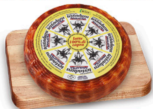
FORMAGGIO DI CAPRA TESTADURA