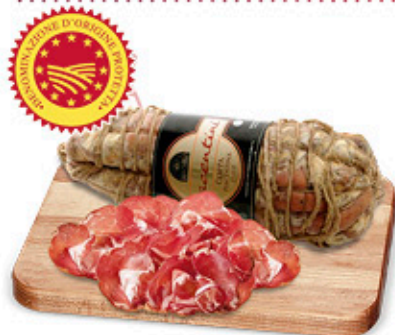
COPPA PIACENTINA DOP NEL REPARTO GASTRONOMIA