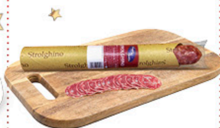
STROLGHINO CON TAGLIERE E COLTELLO 230 g € 21,70 al kg NEL REPARTO RESCHI