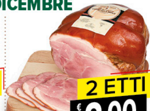
PROSCIUTTO COTTO ALLA BRACE