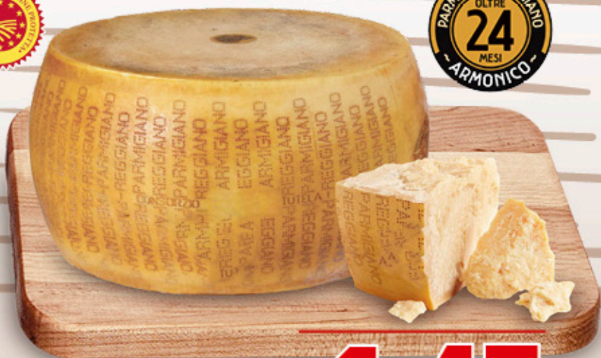
PARMIGIANO REGGIANO DOP STAGIONATO 24 MESI