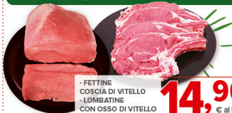
- FETTINE COSCIA DI VITELLO - LOMBATINE CON OSSO DI VITELLO

ACCADDE SOLO NEL WEEKEND! SOLO VENERDÌ 13, SABATO 14 E DOMENICA 15 DICEMBRE