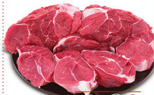
MUSCOLO BOVINO ADULTO