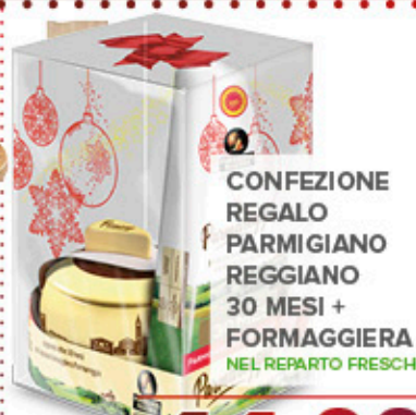
CONFEZIONE REGALO PARMIGIANO REGGIANO 30 MESI + FORMAGGIERA NEL REPARTO FRESCHI