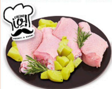
FUSELLI DI POLLO CON PATATE