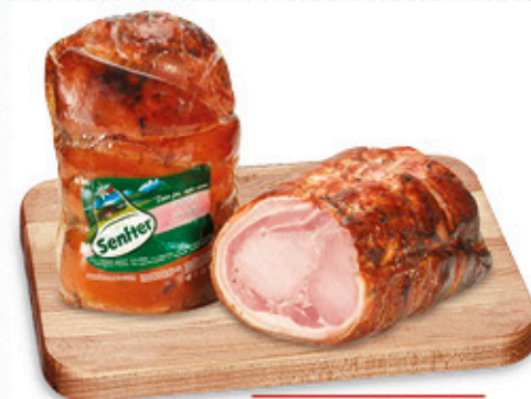
FILETTONE DI PORCHETTA