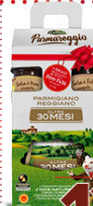
PARMIGIANO REGGIANO 30 MESI CON SALSE FICHI E PERE 250 g € 51,60 al kg NEL REPARTO FRESCHI