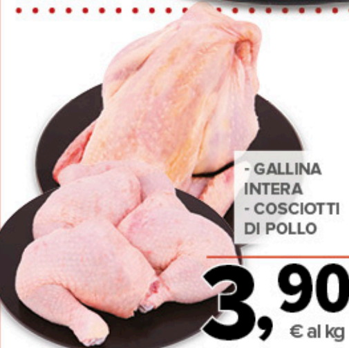
- GALLINA INTERA - COSCIOTTI DI POLLO