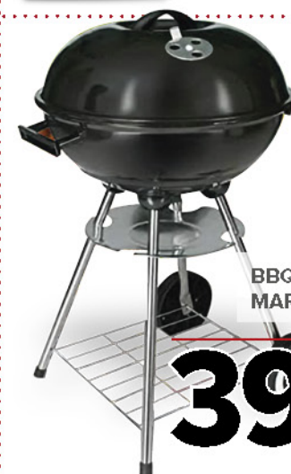
BBQ TONDO MARCHIO BBQ