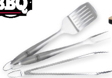
SET 3 UTENSILI BBQ IN ACCIAIO