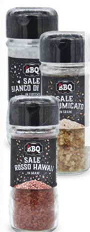
SALE - AFFUMICATO IN GRANI 80 g - ROSSO DELLE HAWAII IN GRANI 90 g - SALE BIANCO DI CIPRO IN FIOCCHI 35 g