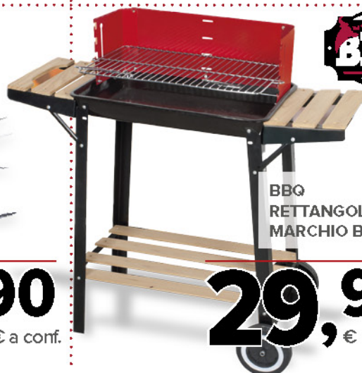
BBQ RETTANGOLARE MARCHIO BBQ