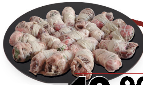
TORCINELLI DI AGNELLO NEL REPARTO MACELLERIA