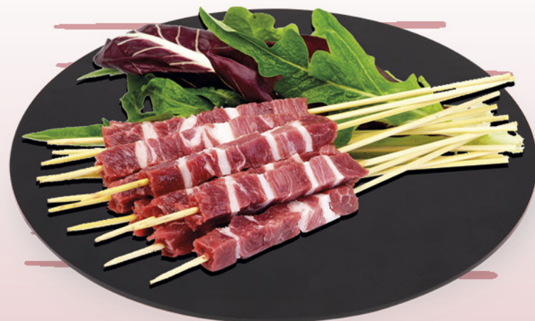
ARROSTICINI DI OVINO NEL REPARTO MACELLERIA