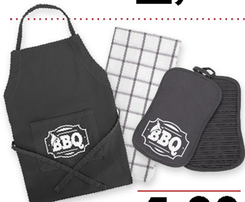
- GREMBIULE BBQ - STROFINACCIO + 2 PRESINE BBQ