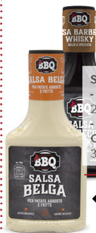
SALSA - BELGA 290 g - € 6,17 al kg SALSA - BARBECUE CON WHISKY 365 g - € 4,90 al kg