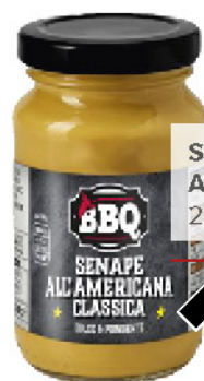
SENAPE ALL'AMERICANA 200 g - € 5,00 al kg