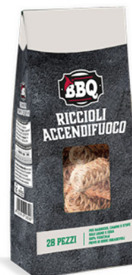
ACCENDIFUOCO IN RICCIOLI 28 PEZZI