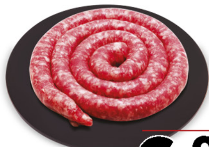
SALSICCIA LUGANEGA DI SUINO NEL REPARTO MACELLERIA

SPECIALE BARBECUE dal 31 Marzo al 9 Aprile