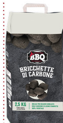
BRICCHETTE DI CARBONE 2,5 kg - € 1,40 al kg