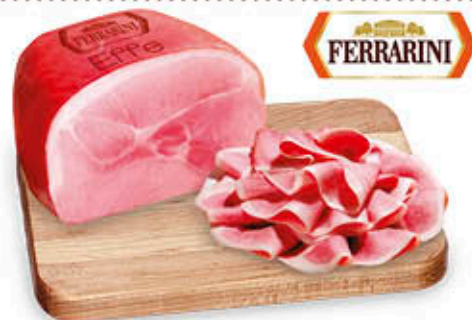
PROSCIUTTO COTTO ALTA QUALITÀ