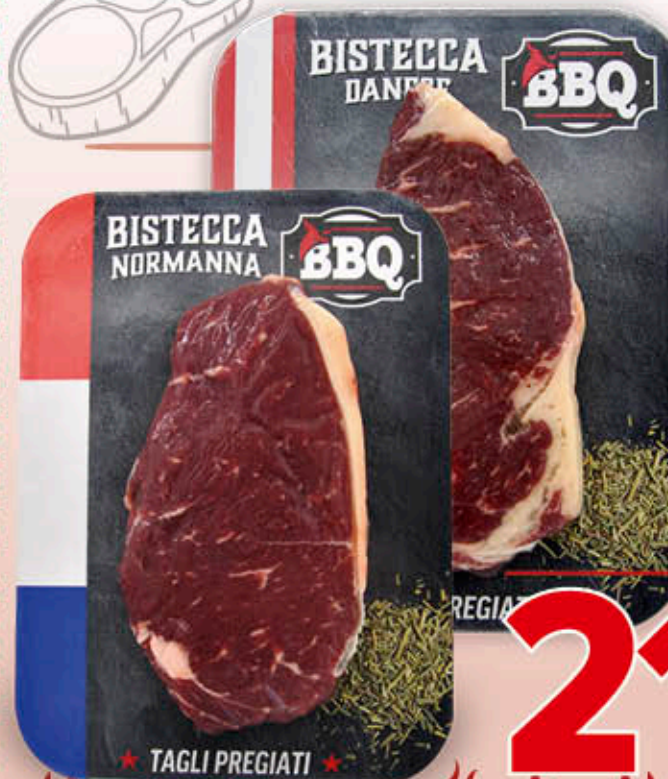
BISTECHE BOVINO ADULTO - DANESE - NORMANNA