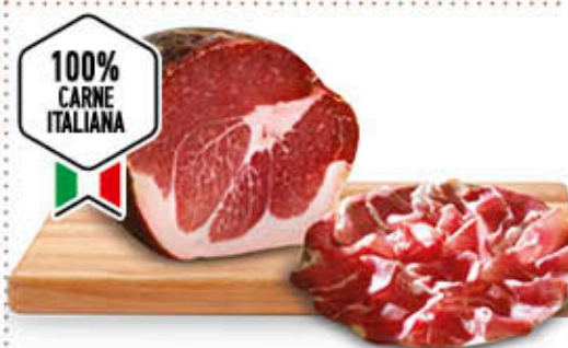
CULATTA NAZIONALE STAGIONATURA 16 MESI