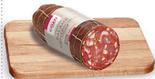
SALAME VENTRICINA PICCANTE