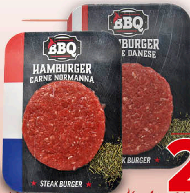
HAMBURGER - NORMANNA - DANESE 180 g - 16,10 al kg