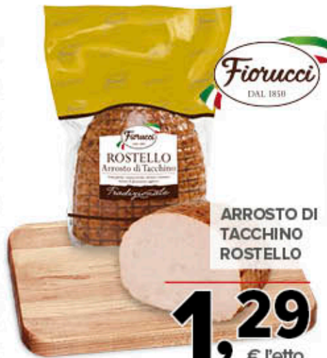
ARROSTATO DI TACCHINO ROSTELLO