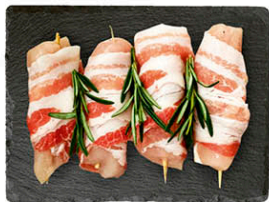
TWIST DI POLLO