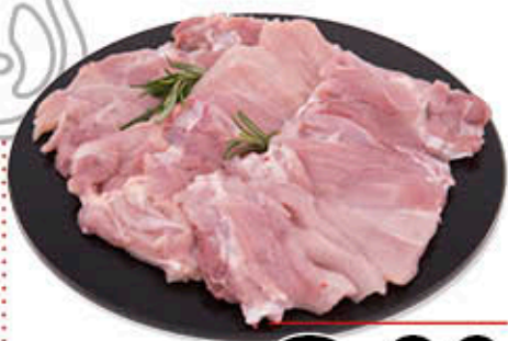
BISTECCA DI POLLO MEDITERRANEA