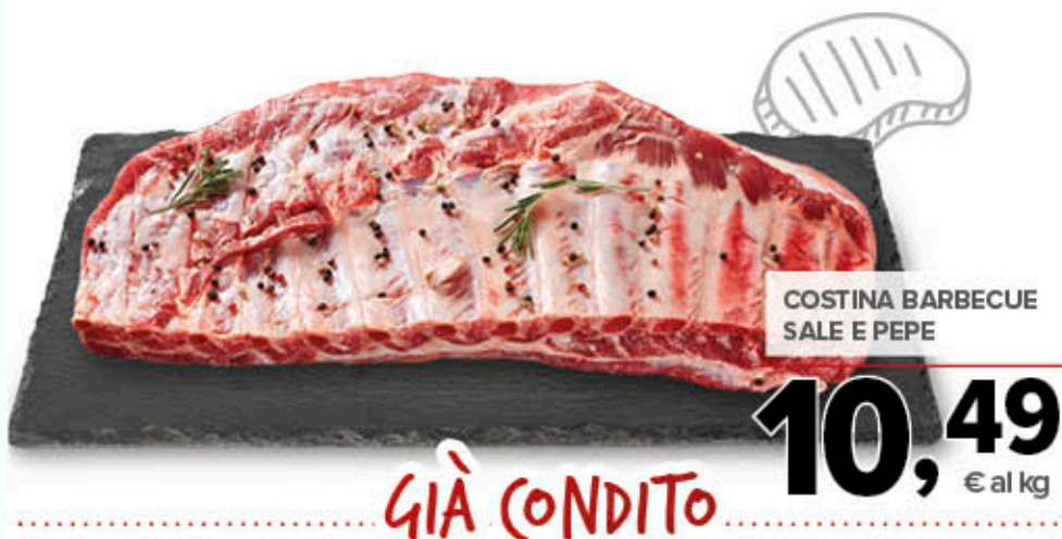
COSTINA BARBECUE SALE E PEPE