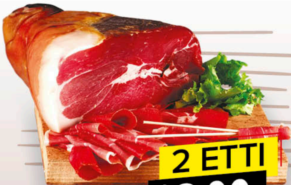
PROSCIUTTO CRUDO STAGIONATO