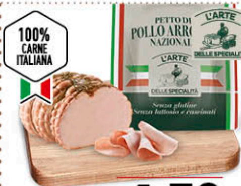
PETTO POLLO ARROSTATO ITALIANO