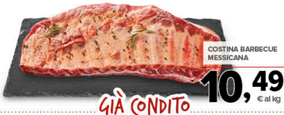
COSTINA BARBECUE MESSICANA