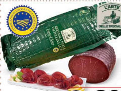
BRESAOLA DELLA VALTELLINA IGP